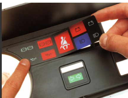
Instrumententafel für KFZ