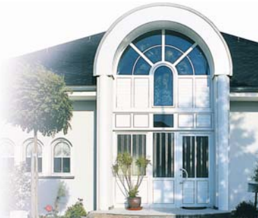
Fenster- und Türfüllungen