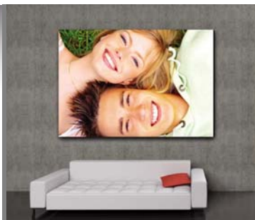
für gestalterische Elemente