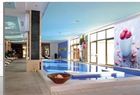
auch im Nassbereich

Diese Spezialversion einer Celuka-Platte hat beidseitig angeschliffene Oberflächen, deren Optik und Haptik an gefirniste Leinwand erinnert und somit eine kreative und künstlerische Bildwiedergabe ermöglicht.