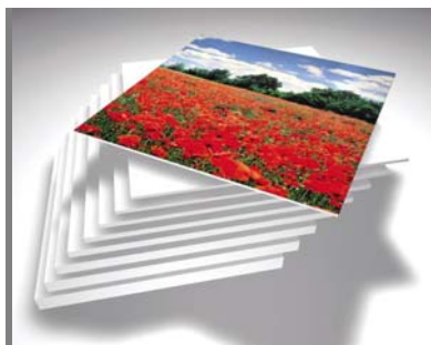
Qualitativ hochwertige Drucke