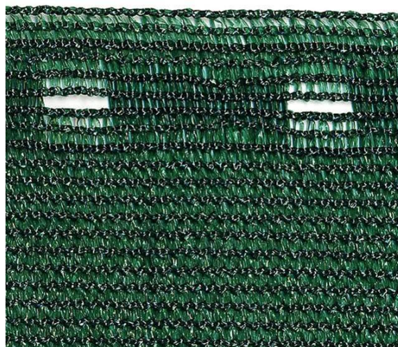
Zaunblende 348 mit Knopflochleiste