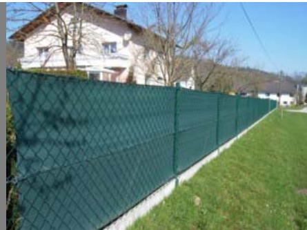
Die klassische Zaunblende

Netze von Wettlinger haben sich als Sichtschutz, zur Abschattung, als Windbrecher und Staubschutz vor allem in der Landwirtschaft, Garten- und Sportplatzgestaltung tausendfach bewährt!