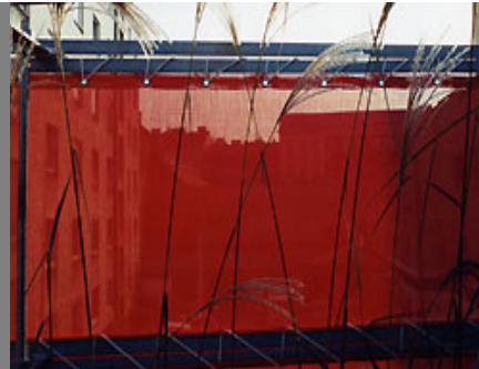
auch in verschiedenen dekorativen Farben