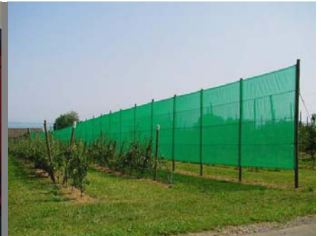
bricht den Wind – schützt Ihre Kulturen