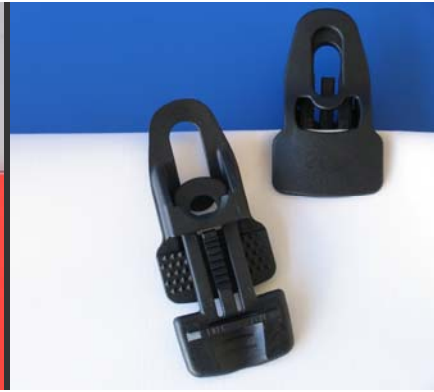
einteilige Version Clip On Midi