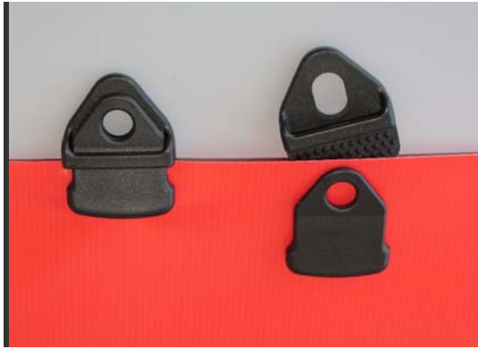
Zweiteilige Version Clip On Mini