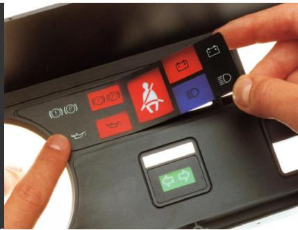
Instrumententafel für KFZ