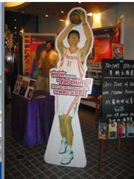
z.B. für stabile Aufsteller

Die Deckschichten bestehen wie bei der regulären AlCoPlast-Platte aus 0,30 mm dicken Aluminium-Blechen, welche mit der gleichen hochwertigen Zwei-Schicht-Einbrennlackierung versehen sind. Der Kern jedoch ist keine Kunststoff-Vollplatte, sondern eine spezielle Polypropylen-Hohlkammerplatte, welche nicht nur eine vergleichbare Stabilität, sondern vor allem eine enorme Gewichtseinsparung mit sich bringt!