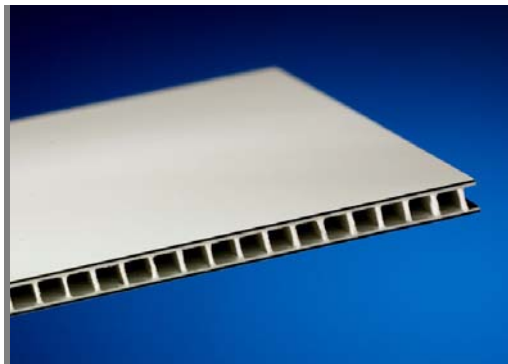
AlCoPlast HK in H-Struktur ist Lagerware