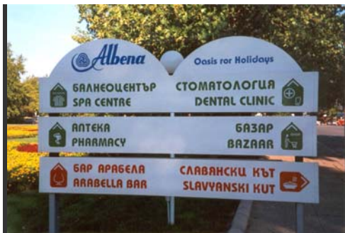
Schilder im Außenbereich