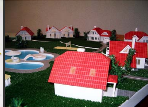
und für den Modellbau

HIPS - hochschlagfestes Polystyrol auf Basis Styrol-Butadien ist ein kostengünstiger Kunststoff mit sehr guten mechanischen Eigenschaften, der sich wunderbar einfach bearbeiten lässt.