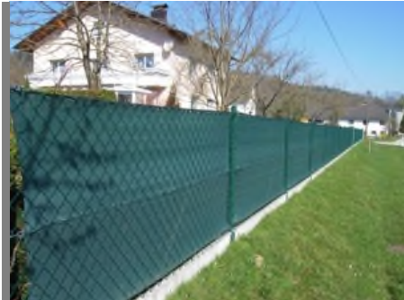
Die klassische Zaunblende

Netze von Wettlinger haben sich als Sichtschutz, zur Abschattung, als Windbrecher und Staubschutz vor allem in der Landwirtschaft, Garten- und Sportplatzgestaltung tausendfach bewährt!