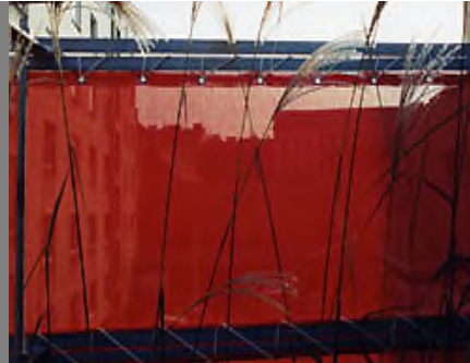
auch in verschiedenen dekorativen Farben