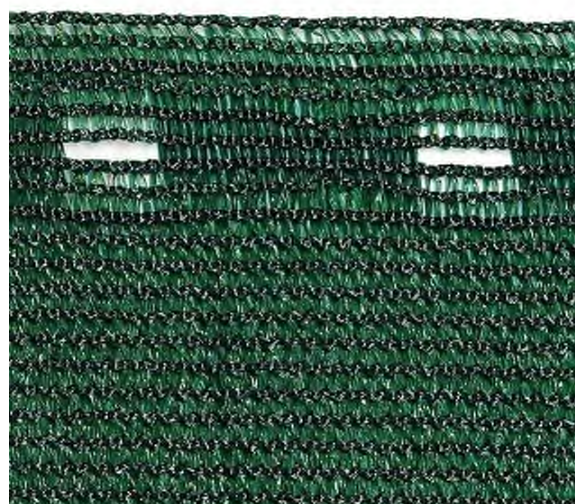
Zaunblende 348 mit Knopflochleiste