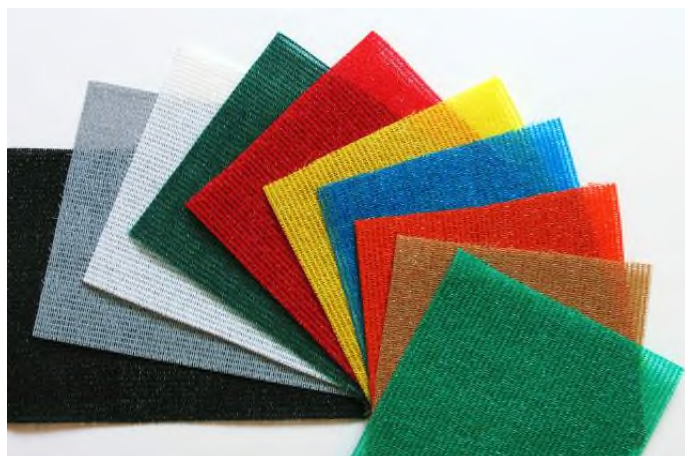
Netze in vielen dekorativen Farben erhältlich!

* Der Schattierwert nach ASTM 1494-92 ist zu einem gewissen Grad von der Netzfarbe beeinflusst. Der hier angegebene Wert gilt für die Farbe dunkelgrün.