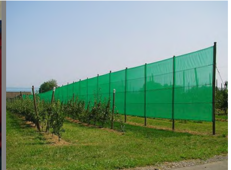
bricht den Wind – schützt Ihre Kulturen